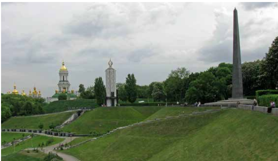
Іл. 5. Меморіал Вічної Слави. Київ. [16]

Меморіалізація російсько-української війни, на прикладі Меморіалу Героїв Небесної Сотні у Львові, репрезентує трансформацію топографії пам'яті через формування нової просторової драматургії, інтегрованої у міський рельєф, що концептуально втілено у проекті. Цей об'єкт є зразком (2019 р.), який демонструє нові підходи. Розташований на складному ландшафтному