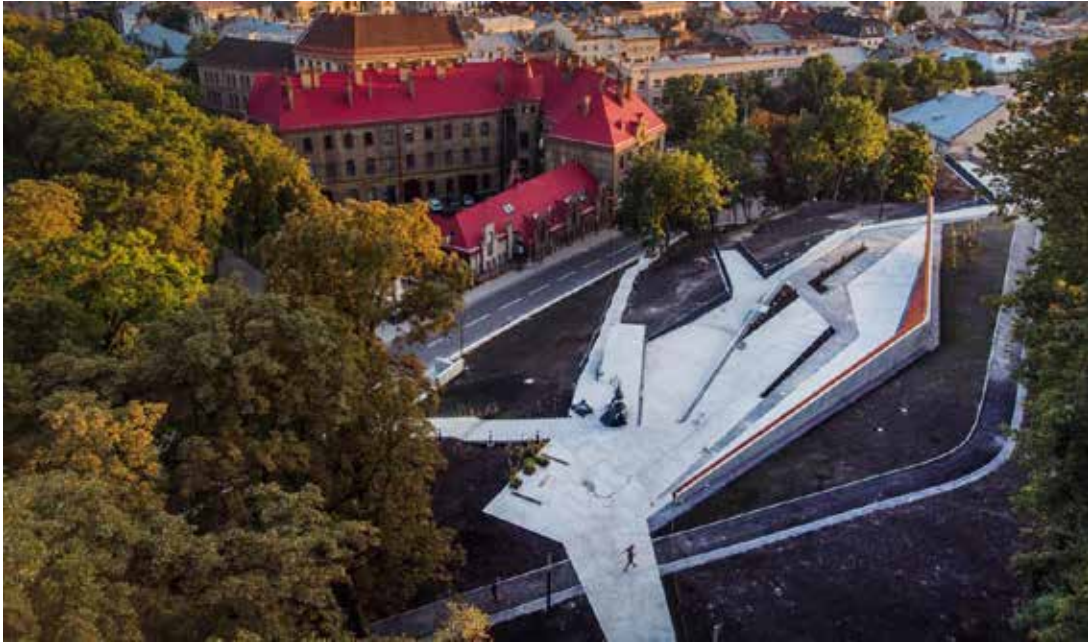
Іл. 8. Меморіал Героїв Небесної Сотні. Львів. [19]

комплексів, військових некрополів. Простір організують за принципами регулярності, ієрархії, ландшафтної інтеграції та екологічної доцільності. Сучасні проєкти військових некрополів демонструють синтез історичних моделей: регулярна сітка поховань (антична впорядкованість), ландшафтна інтеграція (XVIII–XIX ст.), символічна вісь (XX ст.), персоналізація (XXI ст.).