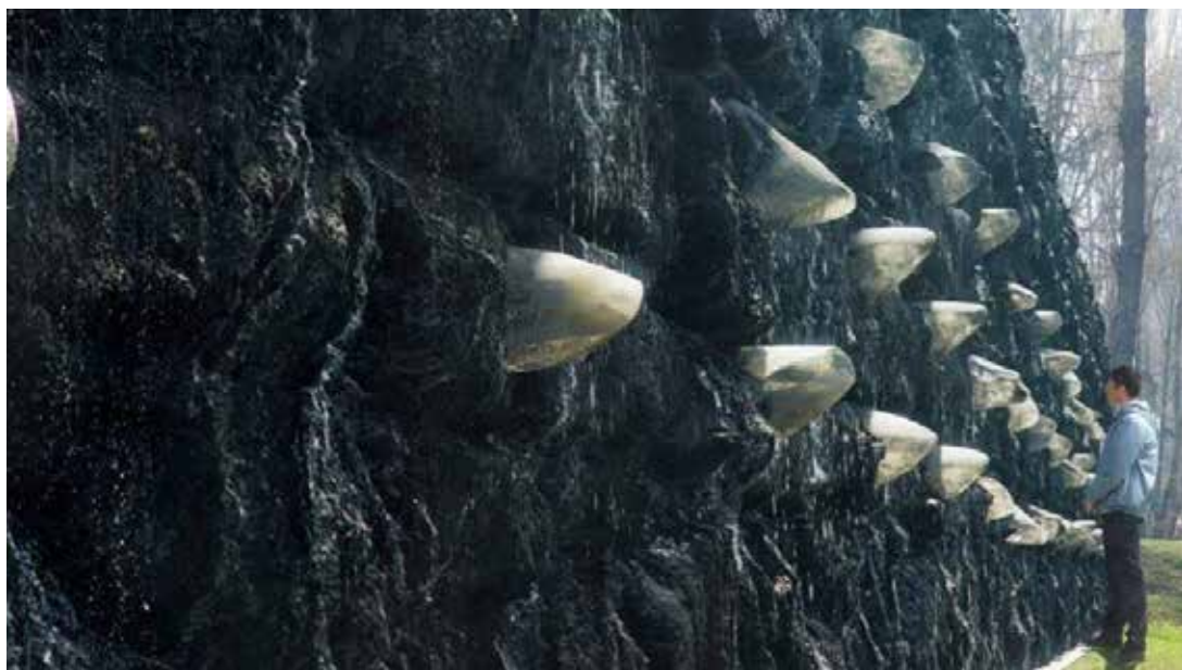
Іл. 7. Інсталяція «Кристалічна стіна плачу». Національний історико-меморіальний заповідник «Бабин Яр». Київ. [18]

розломі між двома рівнями вулиць, меморіал не має вертикального акценту. Основним матеріалом оздоблення є кортенова сталь, що іржавіє, символізуючи «живу рану». Архітектори (арх. бюро Guess Line Architects) інтегрували структуру меморіального комплексу у схил пагорба. Оглядові тераси спрямовані на місто, створюючи візуальну вісь між пам'яттю та майбутнім. Це