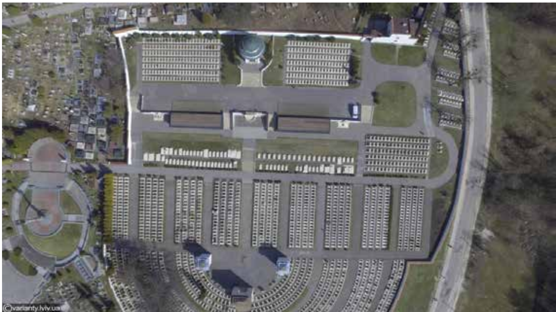
Іл. 4. Личаківський цвинтар у Львові. [15]

комплексів – це ландшафтна інтеграція, ієрархія поховань через розташування на схилах.