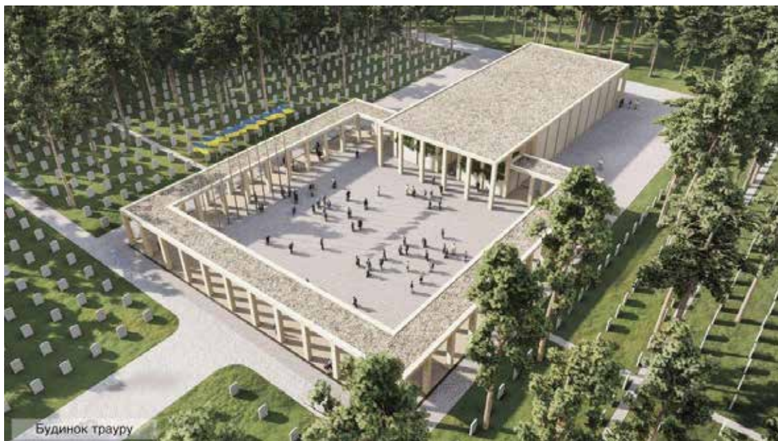
Іл. 9. Проєкт Національного військового меморіального кладовища у Київській області. [20]