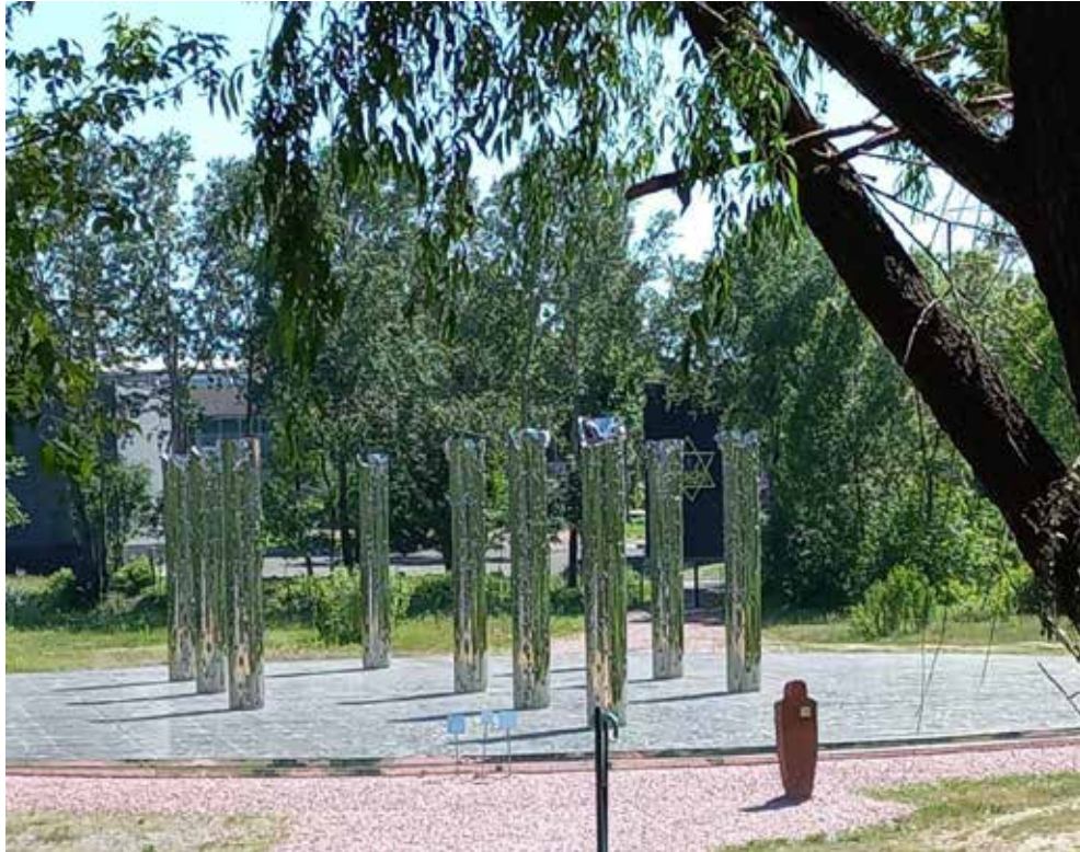
Іл. 6. Інсталяція «Дзеркальне поле». Національний історико-меморіальний заповідник «Бабин Яр». Київ. [17]