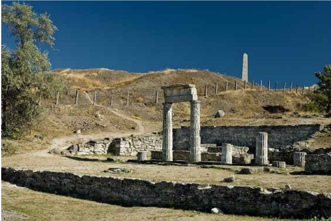
Іл. 2. Некрополь Пантікапея. [13]

замкнений периметр комплексу. У середньовічній Україні поховання також концентруються здебільшого біля храмів, формуючи сакральні осередки. Відбувається інтеграція меморіального простору у містобудівну тканину. Тотожність з попередніми етапами – сакральність і символічна орієнтація. Відмінність – інтеграція у структурний центр поселення. Таким чином виникає сакральньо-центричний тип меморіального комплексу.