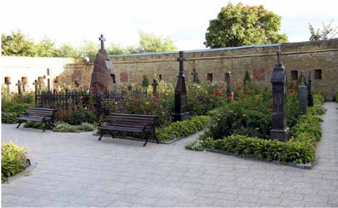
Іл. 3. Некрополь Києво-Печерської лаври. [14]