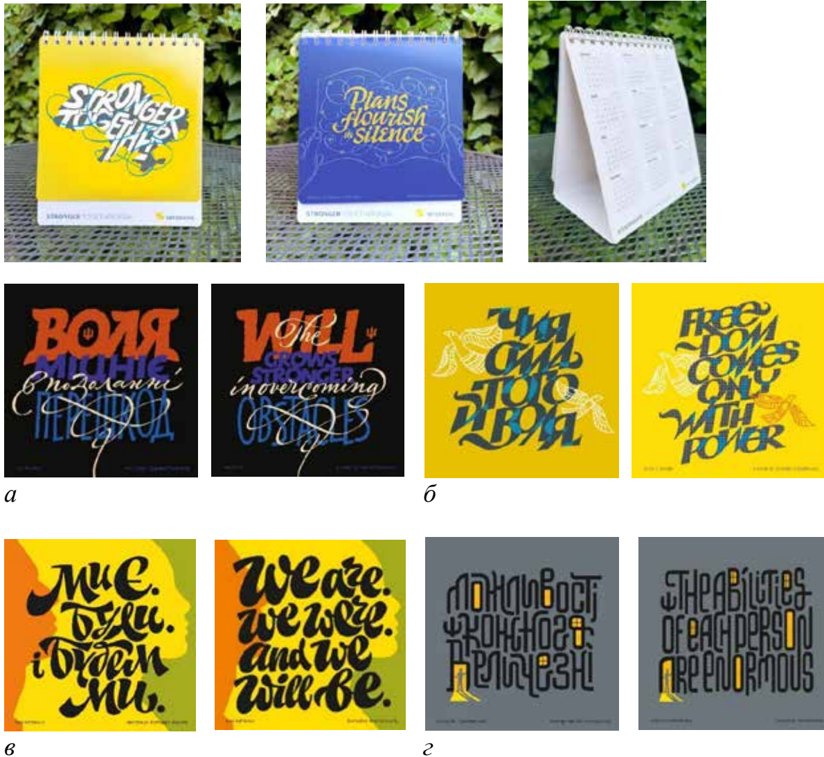
Іл. 2. Обкладинка та аркуші календаря «Разом міцніші». Автори: а – Д. Стьопічева, б – Н. Балабуха, в – К. Яцушек, г – Є. Бердніков (обкладинка). 2023. Календар видано українською й англійською мовами.

та їхніх графічних пошуках. Макет побудовано таким чином, щоб ілюстрації залишалися головним візуальним елементом, тоді як делікатна календарна сітка лише підкреслює їх за допомогою кольору. Шрифтове оформлення, виконане плоским пером, трансформує назви місяців у самостійні артоб'єкти (окремі шрифтові поліритмічні композиції), де поєднано динаміку українського скоропису та класичну форму літер гуманістичного курсиву.