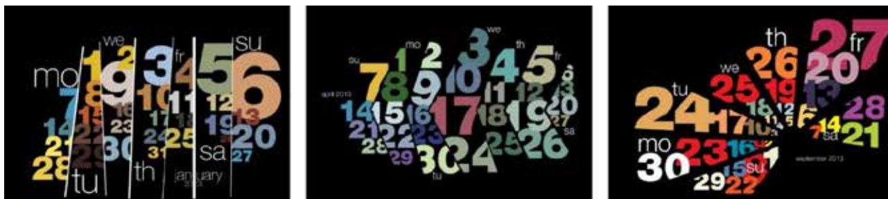
Іл. 1. С. Кудучкар. Аркуші календаря. 2013. [5]