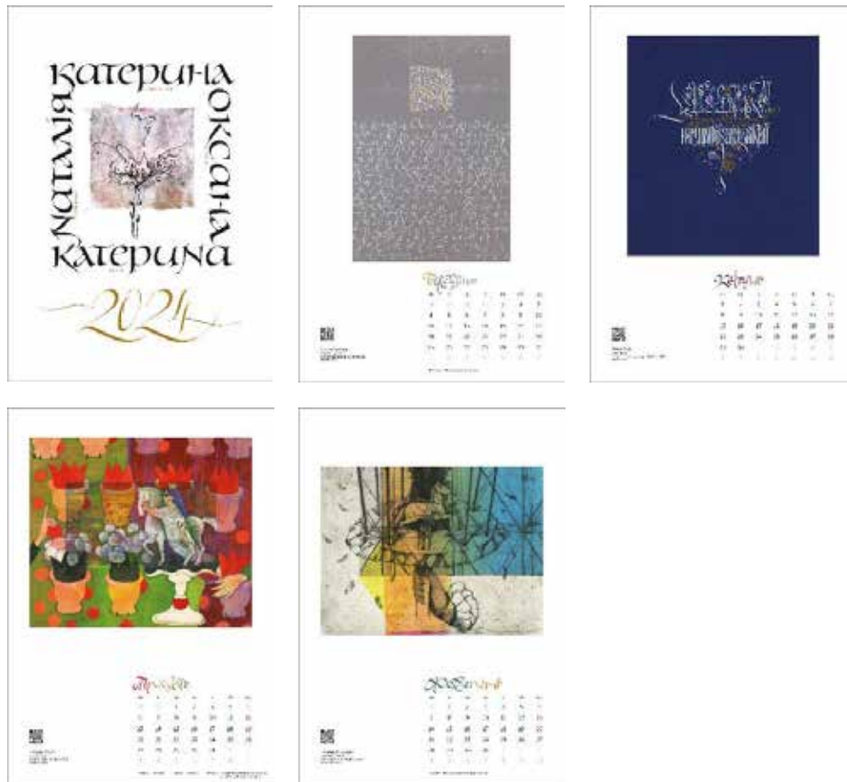
Іл. 3. Обкладинка та аркуші календаря. Автори: Н. Балабуха, О. Здор, К. Радько, К. Свіргуненко. 2023. [Ілюстрації авторів статті]