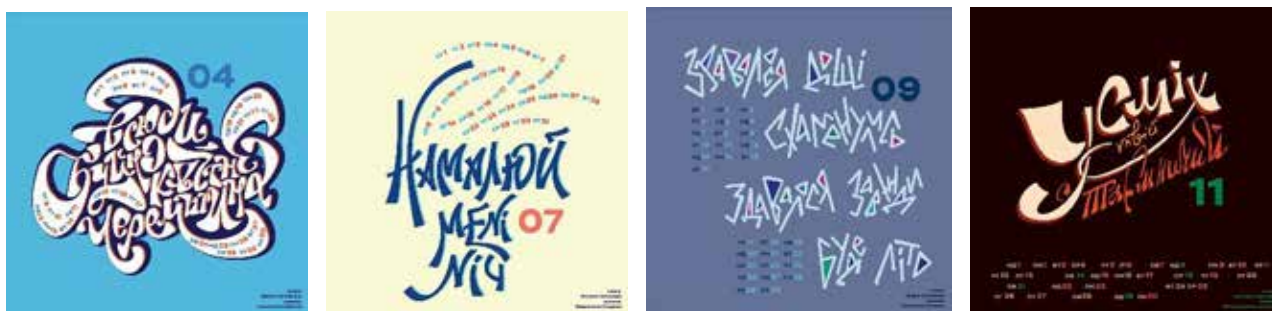
Іл. 8. Р. Артеменко. Аркуші календаря. Студентська робота (кер. О. Здор). 2025. [Методичні матеріали кафедри дизайну НАОМА]