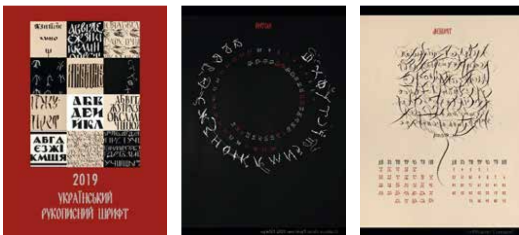
Іл. 7. С. Чепугова. Аркуші календаря. 2018. [Ілюстрації надано С. Чепуговою]

Ревіталізація естетики 1980-х років, що спостерігається у сучасному візуальному дискурсі, стає підґрунтям зв'язку поколінь. Використання музичної тематики цього періоду в дизайні календаря слугує не лише ретроспективним елементом, але й потужним комунікативним інструментом, що об'єднує досвід різних генерацій навколо спільного культурного коду. Через актуальні графічні форми проєкт популяризує українську пісенну спадщину, трансформуючи її з архівного