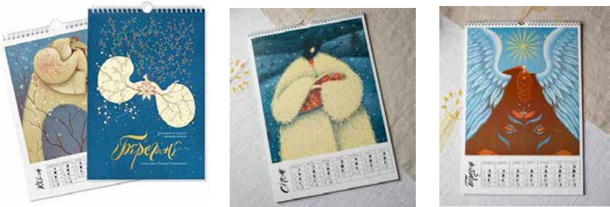
Іл. 5. Аркуші календаря «Берегині». Автори: О. Гайдамака, А. Кізіма. 2024. [9]