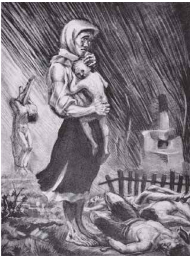
Іл. 1. М. Дмитренко. От так, як бачите (із серії «Нищення України»). Ймовірно, вуглина, папір. 1941. [25]