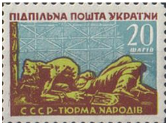
Іл. 13. Марка із серії «СССР – тюрма народів» номіналом 20 шагів. Підпільна Пошта України. 1958. [40]