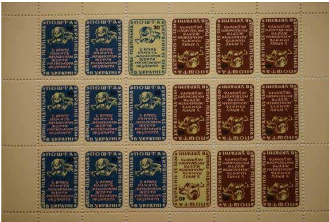
Іл. 7. Марковий аркуш «Голод в Україні. 1932–1933. У вічну пам'ять мільйонам жертв російського окупанта». Підпільна Пошта України, 30 і 40 шагів (по дев'ять марок). 1953. [34]

його полі наклеєна марка із серії 1953 р. номіналом 20 шагів; за нею – дві марки із серії 1958 р. номіналом 10 і 50 шагів; і ще одна марка 1953 р. номіналом 30 шагів. Марки обрамлені оливковими лініями. Над ними надруковані дати «1932» і «1933», а під ними – «1962» і «1963», а також червоний напис великими літерами: «На вічну ганьбу росії». У правій площині надрукований православний трилистий хрест і синій напис великими літерами: «У пам'ять жертв штучного голоду в Україні». Напис «На вічну ганьбу росії» виконано великими літерами у двох кольорах