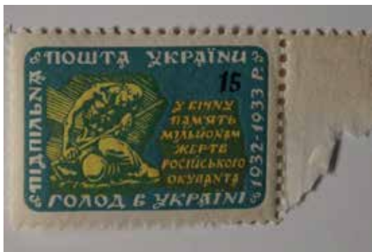
Іл. 8. Марка з серії «Голод в Україні. 1932–1933 р. У вічну пам'ять мільйонам жертв російського окупанта» номіналом 15 шагів. Підпільна Пошта України. 1958. [35]

його полі наклеєна марка із серії 1953 р. номіналом 20 шагів; за нею – дві марки із серії 1958 р. номіналом 10 і 50 шагів; і ще одна марка 1953 р. номіналом 30 шагів. Марки обрамлені оливковими лініями. Над ними надруковані дати «1932» і «1933», а під ними – «1962» і «1963», а також червоний напис великими літерами: «На вічну ганьбу росії». У правій площині надрукований православний трилистий хрест і синій напис великими літерами: «У пам'ять жертв штучного голоду в Україні». Напис «На вічну ганьбу росії» виконано великими літерами у двох кольорах