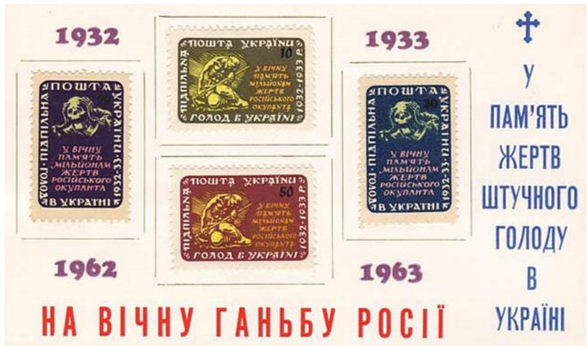
Лл. 10. Наліпковий блок ППУ на згадку 30-х роковин Голодомору. 1962. [36]