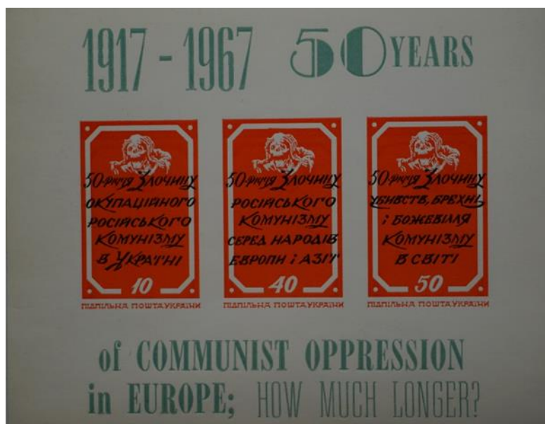
Лл. 11. Марковий блок «1917–1967. 50 years of Communist Oppression in Europe; How Much Longer?». Підпільна Пошта України. 1967. [37]

кольору. На блоці, подарованому Національному музею Голодомору-геноциду В. Штокалом тло марок є червоним.