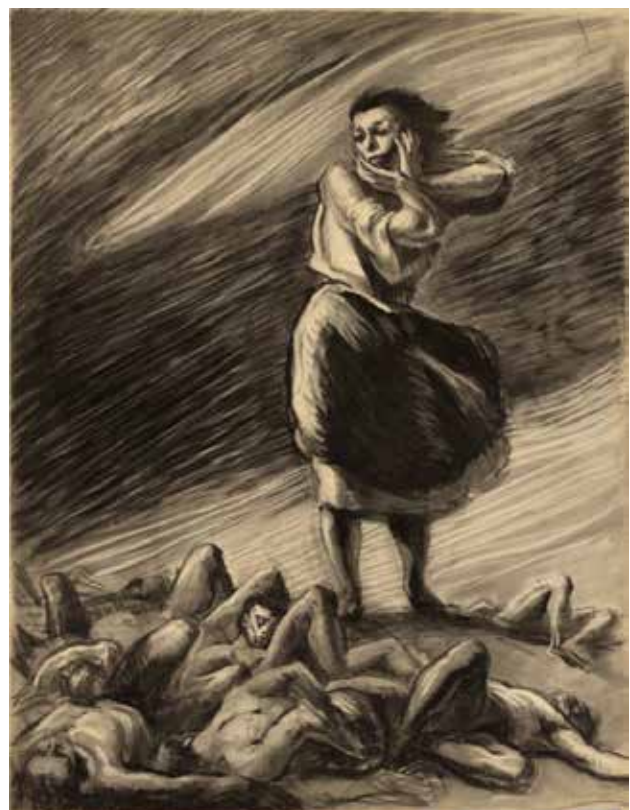
Іл. 3. М. Дмитренко. Можна збожеволіти. Вуглина, папір. 1941 чи 1953. [29]