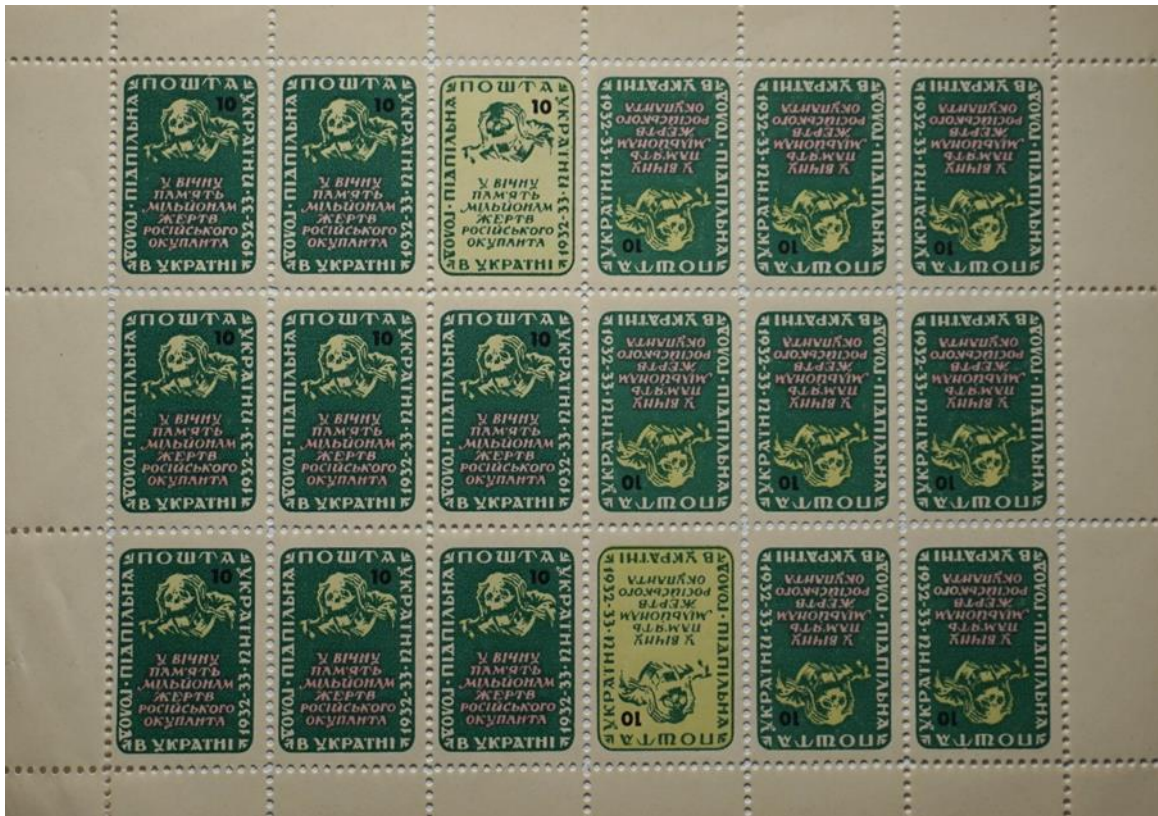
Іл. 6. Марковий аркуш «Голод в Україні. 1932–1933. У вічну пам'ять мільйонам жертв російського окупанта». Підпільна Пошта України, 10 шагів. 1953. [33]

До 30-х роковин Голодомору ППУ знову використала свої марки 1953 та 1958 років. Системна дезінформація СРСР про події 1932–1933 рр. в Україні та мовчання світу щодо цього тяжкого злочину стимулювали зарубіжне українство до дій. У 1962 р. ППУ випустила комеморативний і пропагандистський наліпковий блок (іл. 10). На