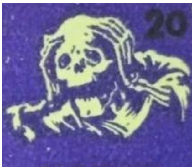
Іл. 4. Фрагмент марки ППУ номіналом 20 шагів із серії в пам'ять жертв Голодомору. Мал. М. Дмитренка. 1953 [31]

В. Штокало передав у Національний музей Голодомору-геноциду сім цілих аркушів у доброму стані, кожен з яких має 18 зубцьованих марок, і частину марочного аркуша із 15 зубцьованими марками цього типу. Чотири аркуші містять марки одного номіналу – 10 (іл. 6), 20, 30 і 40 шагів, які групами по дев'ять одиниць різнообернені стосовно одна до одної. Три ж аркуші поєднують по дев'ять марок двох номіналів, які в аркуші розташовані різнообернено – 20 і 10 шагів, 10 і 30 шагів, 30 і 40 шагів (іл. 7). У неповному марочному аркуші збережено шість