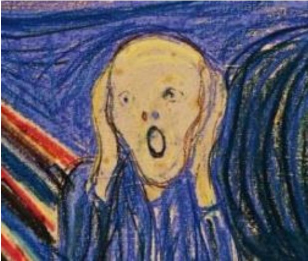
Іл. 5. Едвард Мунк. Крик. Фрагмент. 1895. [32]

марок номіналом 40 шагів і дев'ять марок номіналом 10 шагів.