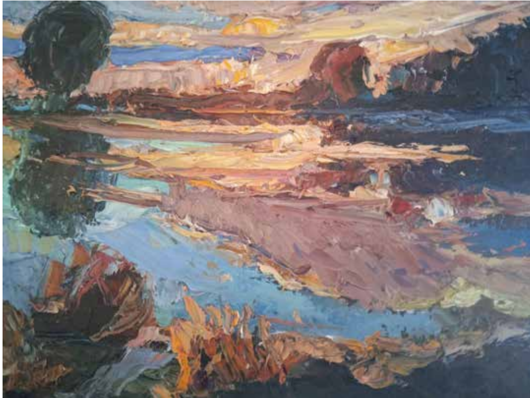
Іл. 5. А. Гайдар. Вечір. Полотно, олія. [14]

Творчість автора статті ( Андрія Нікітіна ) зосереджена на пейзажній ліриці, намаганні дослідити мінливу естетику природи, на її здатності до постійного оновлення та емоційного перевтілення. Щоб передати атмосферу природи автор поєднав техніку виконання з передачею просторових та кольорних нюансів.