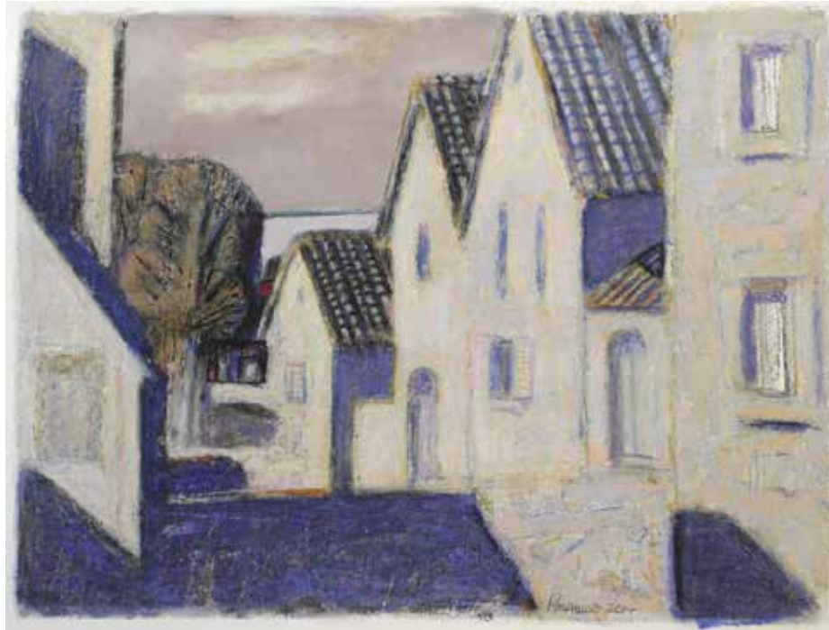
Іл. 2. Ю. Рубашов. Сен-Мало. Франція. Папір, акрил. [11]

«Вечір у Карпатах» (обидва – 2000), «Канівські далі», «Юність» (обидва – 2005), «Край І. Франка. Криворівня» (2009) автор виявляє глибоку зацікавленість екзистенційною сутністю ландшафту, трансформуючи натурні спостереження у філософську рефлексію.