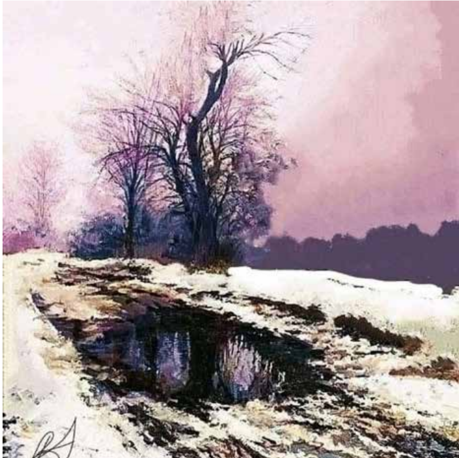
Іл. 3. В. Магальс. Весняна ляповиця. Картон, акварель, гуаш. [12]

майстерність поєднується з філософським зануренням у глибини буття, досягаючи гармонійної єдності змісту та форми.