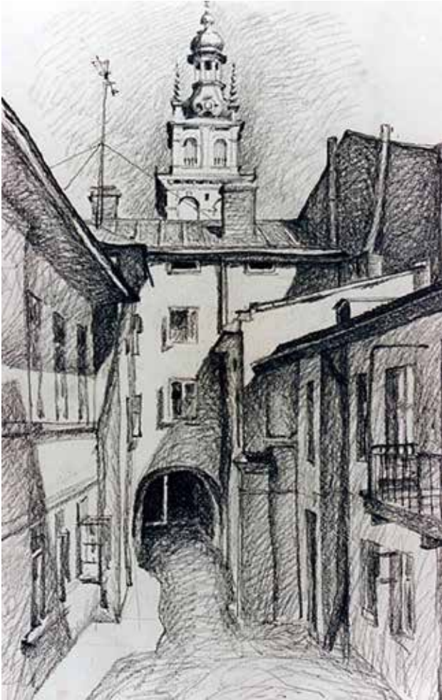
Іл. 4. Ю. Ларіонов. Львів. Папір, сепія. [13]

художнього дослідження. Митець ретельно опрацьовує архітектурні ордери та інженерні деталі, що свідчить про глибоке розуміння тектоніки та будівельних особливостей різних історичних епох. Він поєднує реалістичну точність з елементами декоративної стилізації, надаючи архітектурним образам особливої естетичної виразності, використовує складні світлотіньові градації та вивірену лінійну структуру для моделювання об'ємно-просторових рішень. Таким чином автор синтезує емоційне занурення в природу та раціональне усвідомлення архітектурної форми. Його роботи не лише фіксують візуальні характеристики об'єктів, а й формують складний поетичний контекст, занурюючи глядача в історичну ретроспективу та філософські роздуми про тяглість часу й гармонію буття.