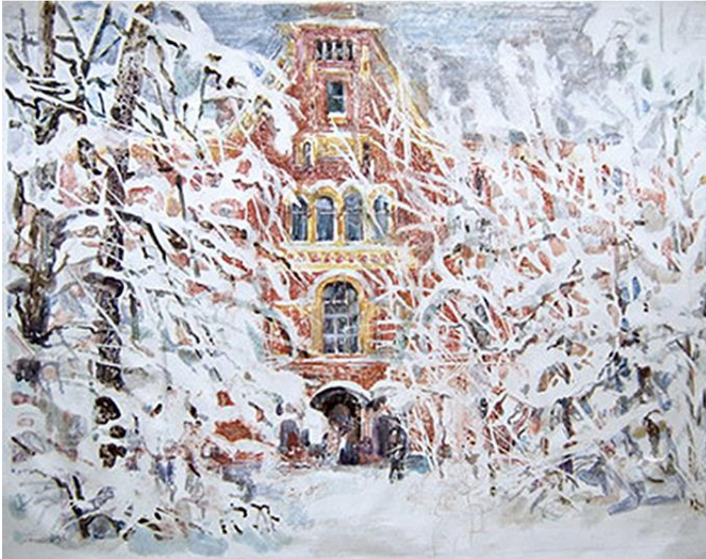
Іл. 6. А. Нікітін. Академія. Папір, монотипія. 35×50.

досягти ефекту марева, коли будівлі ніби проступають крізь зимовий пейзаж. Тонкі темні лінії дерев, додані поверх відтиску, додають графічної чіткості – саме так автор намагався закцентувати увагу на крихкості природи.