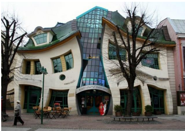
Іл. 6. «Кривий будинок» в Сопоті. Польща. (Арх. М. Шотинська і Л. Залеський). 2004. [16]