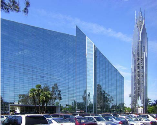
Іл. 4. Кришталевий собор у Гарден-Гроув, Каліфорнія, США. (Арх. Ф. Джонсон). 1980–1990. [14]