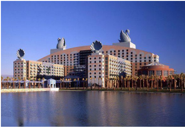
Іл. 2. Готель «Лебідь» (Дісней Ворлд). Орlando, США. (Арх. М. Грейвс). 1990. [12]

Наступним прикладом постмодерністських підходів до формоутворення, що також має яскраво виражені прояви кітчю, є споруда готелю авторства одного з найоригінальніших американських архітекторів сучасності М. Грейвса (Michael Graves) (іл. 2). Збудована на замовлення компанії «Дісней Ворлд» («Disney World»), вона містить комерційні концепції світу Волта Діснея (Walt Disney), вільно інтерпретує образну складову мультфільмів компанії.