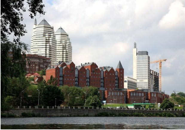
Іл. 8. ЖК «Амстердам» у Дніпрі. (Арх. О. Дольник, В. Сидоренко, Л. Царицина). 2005. [20]

Інші ознаки атрактивності отримала архітектура Майдану Незалежності у Києві, завдяки поєднанню всіх можливих стилістичних напрямків: від класицизму та козацького бароко до хайтеку.