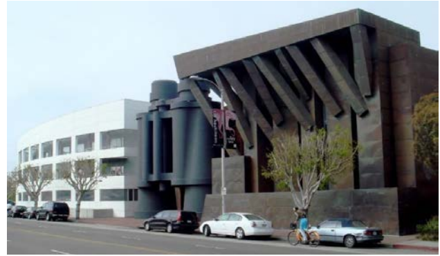
Іл. 3. «Будинок-бінокль». Лос-Анжелес, США. (Арх. Ф. Гері). 1991. [13]

Яскравим зразком постмодернізму є також оригінальна архітектурна споруда «Будинок-бінокль» (Binoculars building, Лос-Анжелес, США) (іл. 3), авторства Ф. Гері (Frank Gehry) – канадсько-американського архітектора, відомого апологета постмодернізму і деконструктивізму