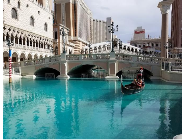
Іл. 5. Курортний комплекс «Венеційський Лас-Вегас». Лас-Вегас, США. (Арх. фірма KlingStubbins). 1999. [15]

початку творчого шляху був прихильником інтернаціонального стилю. У 1960-х роках, з падінням популярності модернізму, Ф. Джонсон почав створювати проекти з алюзіями на історичні стилі. Так з'явилася грандіозна споруда Кришталевого собору в Гарден-Гроув, яка відсилає нас до готики. Мало кому відоме місто Гарден-Гроув може похвалитися найбільшою скляною спорудою у світі. Храм на 2700 відвідувачів було спроектовано для протестантської церкви містечка Гарден-Гроув поблизу Лос-Анжелеса (з 2013 р. собор належить римо-католицькій церкві).