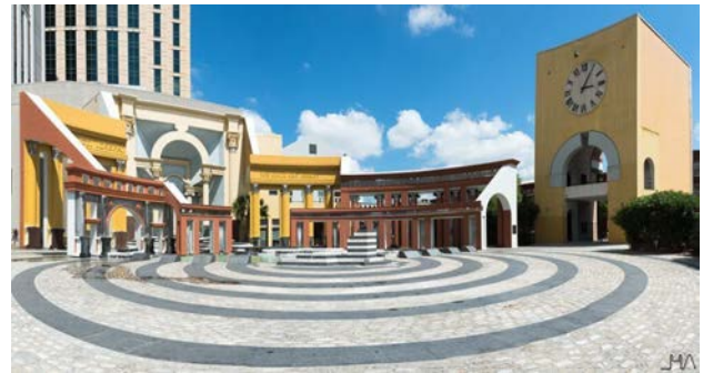
Іл.1. Площа Італії (Piazza d'Italia). Новий Орлеан, США. (Арх. Ч. Мур). 1978. [11]

Виклад основного матеріалу. Зважаючи на те, що постмодерністська архітектура і власне постмодернізм вперше з'явилися у США та європейських країнах, аналіз явища розпочнемо з досвіду закордонних архітекторів, а конкретніше – з площі Італії (Piazza d'Italia) (іл. 1).