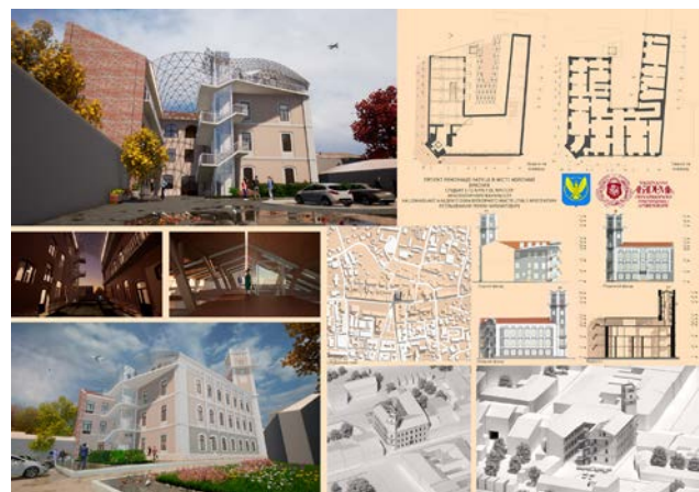
Іл. 4. Проєкт реновації ратуші у м. Коломій (виконавець Р. Петльований; куратори: Г. Олійник, О. Пашник). 2023 р. [4; 8]

коломийської забудови представили на звітній презентації [8].