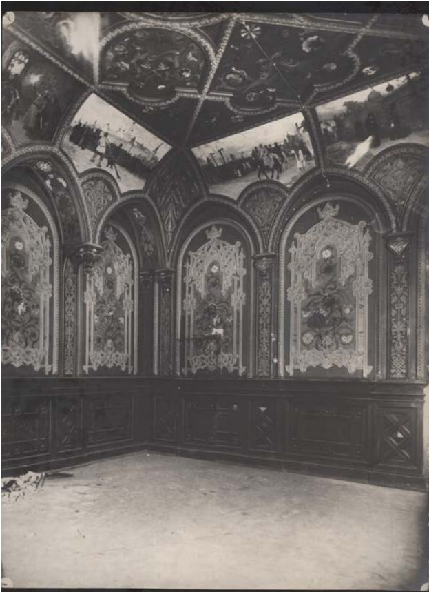
Іл. 1. Інтер'єри будинку по вул. Карла Лібкнехта (Шовковичній), 17. Російська зала. Оформлення стін. Світлина 1934 р. [6]

і збереженості первинного вигляду. Цікаві й дуже цінні знахідки щодо інтер'єрів будинку – детальний аналіз робіт архітектора П. Альошина, за проектом якого у 1934 р. було реконструйовано особняк. На фотографії цього періоду (іл. 1), можемо побачити і проаналізувати стан декору та живописні панно, що раніше були в падухах кабінету, й порівняти їх з сучасним виглядом.