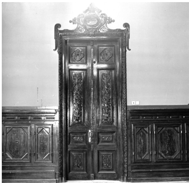
Іл. 3. Інтер'єри будинку по вул. Карла Лібкнехта (Шовковичній), 17. Ідальня. Двері й частина стіни. Світлина 1982 р. [6]