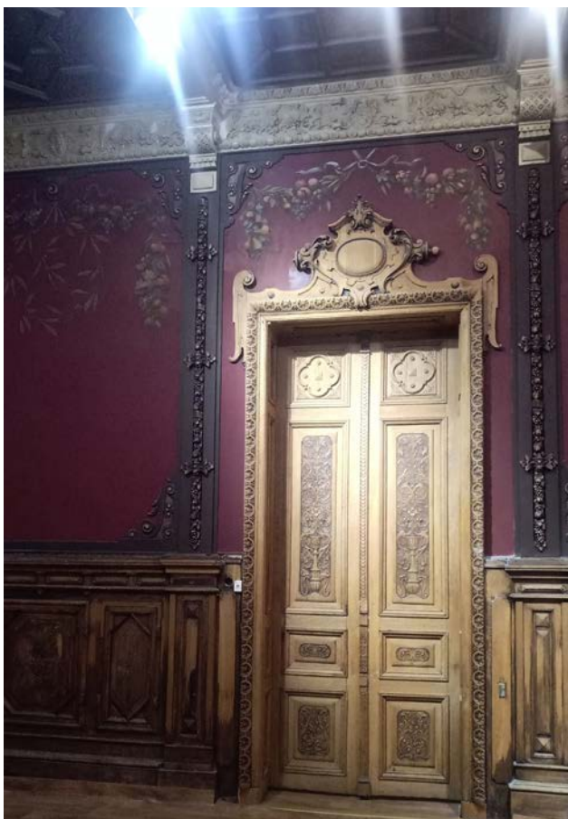
Іл. 7. Інтер'єри Мистецького центру «Шоколадний будинок». Їдальня / Гранатова зала.

У процесі нинішньої реставрації, яку проводять автори статті, в Гранатовій залі (їдальні) було виявлено нашарування декількох художніх реконструкцій минулих років – стіни гранатового кольору й зображення фруктових гірлянд. Оскільки стіни тоновані по всій площині в один колір гранатового відтінку та за своєю живописною композицією мають лише орнаменти на верхній частині, цінні збережені елементи були віднайдені минулими реставраторами саме на верхніх орнаментах із зображенням фруктів. Наразі можна помітити крихітні збережені ділянки, які оточені реставраційними тонуваннями та реконструкцією зображення. Живописні відновлення цих орнаментів налічують не менше двох, у деяких місцях трьох шарів реставраційних тонувань, виконаних у різні роки. Отже, з'явилася можливість проаналізувати збереженість первинних розписів і водночас більш пізніх реконструйованих елементів зображень. Також став у пригоді аналіз історичних фотографій та їх порівняння