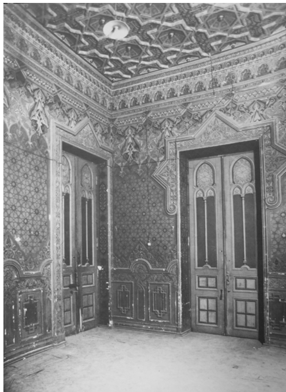
Іл. 5. Інтер'єри будинку по вул. Карла Лібкнехта (Шовковичній), 17. Мавританська зала. Світлина 1934 р. [6]

Під час нацистської окупації особняк зазнав значних пошкоджень, що призвело до повної втрати однієї зали. За усною інформацією від людей, які ще пам'ятали її зовнішній вигляд, – зала була виконана в японському стилі. Усунення пошкоджень і перепланування будівлі відбулося вже у 1948 р. Головним управлінням спеціального будівництва (Головспецбудом) [3].