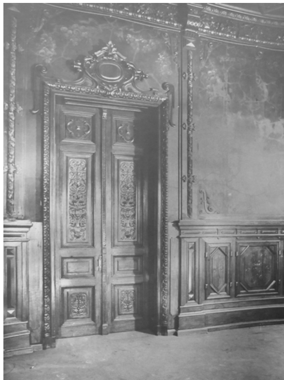
Іл. 6. Інтер'єри будинку по вул. Карла Лібкнехта (Шовковичній), 17. Їдальня. Двері й частина стіни. Світлина 1934 р. [6]