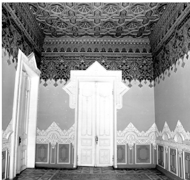
Іл. 2. Інтер'єри будинку по вул. Карла Лібкнехта (Шовковичній), 17. Мавританська зала. Світлина 1982 р. [6]

У документах з описом виконаних робіт є декілька фотофіксацій до реставрації (іл. 2, 3, 4) та документ із архіву інституту