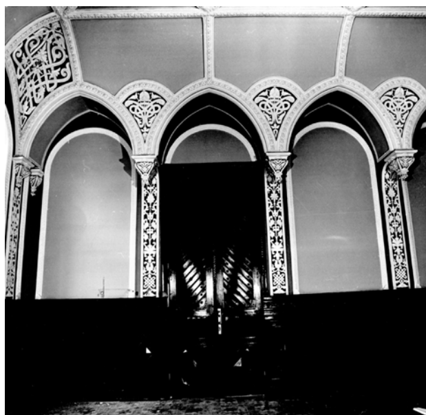
Іл. 4. Інтер'єри будинку по вул. Карла Лібкнехта (Шовковичній), 17. Російська зала. Оформлення стін. Світлина 1982 р. [6]