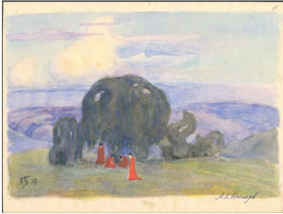
Лл. 5. О. Богомазов. Молитва просто неба. Папір, акварель. 26,2×19,5 см. 1907 [Ф. 360, Оп. 1, Сп. № 50 ЦДАМЛМ]

Ліричний мотив прогулянки у саду в період 1900–1910-х років доволі популярний сюжет, зокрема і серед українських митців. Сад, ліс, природне середовище виступають тут як особливий простір, частина духовного світу, де перебувають чисті духом і втаємничені. Передусім тут згадуються твори і образи знакових представників символізму та спорідненого руху набідів – Пюві де Шавана та Моріса Дені, які мають спорідненість з образами О. Богомазова. Це твори «Надія» (1870-ті) Пюві де Шавана; «Квітень» (1902), «Музи» (1903), «Відображення у фонтані» (1907) Моріса Дені. Також і «Осінь. Роздуми» (1910-ті) В. Замирайла.