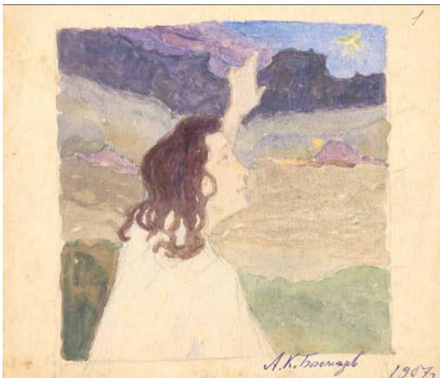
Іл. 1. О. Богомазов. Провідна зоря. Папір, акварель. 17×14,5 см. 1907 [Ф. 360, Оп. 1, Сп. № 53 ЦДАМЛМ]

символізм, цю тему активно розробляють різні митці у різних техніках. Це «Явлення» (1876) Гюстава Моро; «Початок життя» (1900) і «Шлях тиші» (1903) Франтішека Купки; «Привид» (1910) Оділона Редона; «Жертва Світовидові» (1910) Олени Кульчицької; «Комета» (1910) Георгія Нарбута; «Мудрість Еклезіаста» (1909) і обкладинка до журналу «Українська хата» (1910) Михайла Жука; «Зруйнований спокій» (1916) Юхима Михайліва; «Демон» і «Відьма» (1910-ті) Віктора Замирайла. Навіть у колористиці часто домінують темні відтінки синього та фіолетового спектрів — кольори нічного зоряного неба, таємничих водойм, сновидінь. У камерних творах О. Богомазова з колекції ЦДАМЛМ України, які виконані аквареллю, — «Провідна зоря» (1907) 3 (іл. 1) та «Русалка» (1907) 4 — відображено казкову мрію символістської естетики, виконану в традиційному художньому стилі. Сяюча зірка «Провідної зорі» над темним вечірнім лісом не залишає сумніву, що є дороговказом до світу духовного, а казкова постать морського створіння, що спирається на скелю, нагадує одного з врубелівських демонів. Твори не завершені, але дають змогу характеризувати стилістику митця. Позбавлені декоративних та будь-яких етнічних, історичних елементів. До цієї групи творів належать і «Чаклуни» 1907 року з приватної колекції за малюнком «Споочинок під деревами» також 1907 року (за О. Кашубою-Вольвач) [1, с. 181].