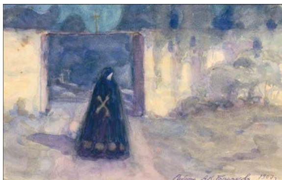
Іл. 3. О. Богомазов. Смерть біля цвинтаря. Папір, акварель. 24,7х15,6 см. 1907 [Ф. 360, Оп. 1, Сп. № 55 ЦДАМЛМ]

«Смерть біля цвинтаря» О. Богомазова привертає особливу увагу. Вишуканий акварельний твір виразного горизонтального