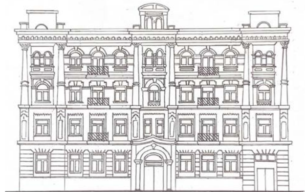
Іл. 2. Прибутковий будинок. Київ, вул. Велика Житомирська, 13. (Арх. М. Казанський). 1901. [Рис. А. Гученко]

відміну від особняка, прибутковий будинок – це багатоквартирна житлова будівля у декілька поверхів. Найбільш поширеним був односекційний варіант прибуткового будинку, в якому на поверсі з двох боків до основних (парадних) сходів прилягали дві квартири з розвинутим розплануванням на 5–8 кімнат різного призначення, як-от: передпокій, вітальня, кабінет, спальні, їдальня, кухня, дитячі кімнати, санітарні вузли, комори тощо, а також помешкання служниці з окремими сходами і входом. Основні кімнати квартири були зорієнтовані вікнами на вулицю й розміщувались уздовж головного фасаду, інші виходили вікнами у двір. Прикладами таких помешкань є прибуткові односекційні будинки на вулиці Великій Житомирській, №№ 13 і 23; на вулиці Бульварно-Кудрявській, №№ 19 і 38; на вулиці Івана Франка, 17; кілька подібних пам'ятоквих будівель збереглися й на вулиці Ярославів Вал (будинки №№ 4, 14, 16) та на інших київських вулицях.