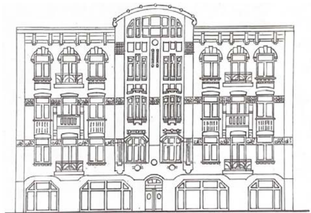
Іл. 3. Прибутковий будинок. Київ, вул. Бульварно-Кудрявська, 19. (Арх. М. Клуґ). 1910. [Рис. А. Гученко]