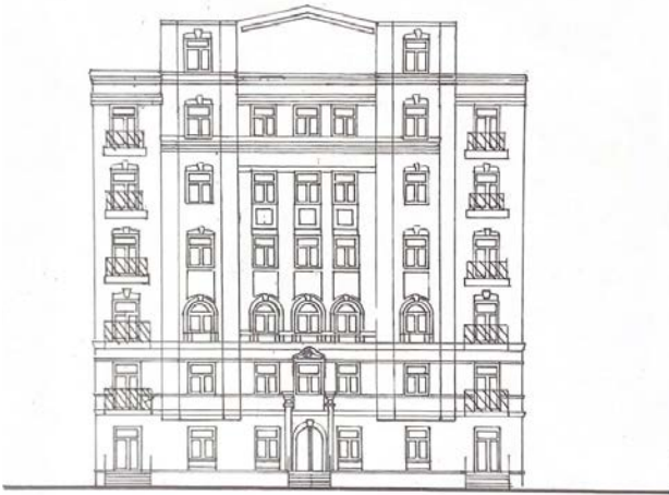
Лл. 4. Прибутковий будинок. Київ, вул. Івана Франка, 17. (Арх. В. Риков). 1915. [Рис. А. Гученко]