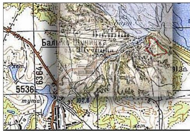
Іл. 2. Накладення карти Балико-Щученки XIX ст. на сучасну топографічну мапу із вказаними приблизними абрисами городища Чучин. [авторська схема Балико-Щучинки на базі оцифрованої мапи Європи XIX ст. [8] та сучасної топографії]

якого розходяться осі-промені у південно-західному напрямку. На жаль, церква не збереглася. Храм та подільну частину села було затоплено водами Канівського водосховища. Однак маємо нагоду проаналізувати просторовий каркас села Балико-Щученка за малюнком, представленим у «Медико-топографічному описі державної власності Київського округу», укладеному в XIX доктором медицини П'єром де ла Фліз [15, с. 609] (іл. 3). На ілюстрації чітко простежуються дві основні планувальні осі, які й до сьогодні сходяться над високим берегом Дніпра на площі, де розташована дерев'яна одноверха тридільна церква – одна з типових форм для церков Київщини згідно з монографією Юлії Івашко [6]. Позаду церкви зображено високий пагорб, де і розташовувалось літописне місто Чучин.