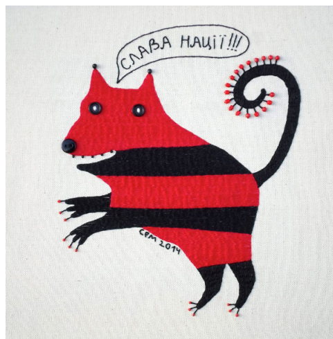
Іл. 3. І. Семесюк. «Бандеркіт». 2014. [5]

У 2015 р. постмайданні рефлексії спонукали представників групи СВХ І. Семесюка