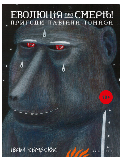
Лл. 8. Обкладинка книжки «Еволюція або смерть! Пригоди павіана Томаса». [12]

Монохромне вирішення перенесене також на обкладинку видання «Фаршрутка». Знайомий за першим виданням «мавпун» Томас знову зображений усміхненим. Графічно виконана постать на повний зріст, що виділяється білою плямою на чорному тлі: «мавпун» біжить, і лінії під його ногами додають динаміки. Одежа героя – спортивні штани та кофта, поєднані з лицарським обладунком – шоломом та саботонами. У правій руці павіан тримає меч, лезо якого закінчується держакон та полотном лопати, що символізує його «аграрне» походження. Навколо фігури йде текстова композиція – цитата з книги: «Ab imo