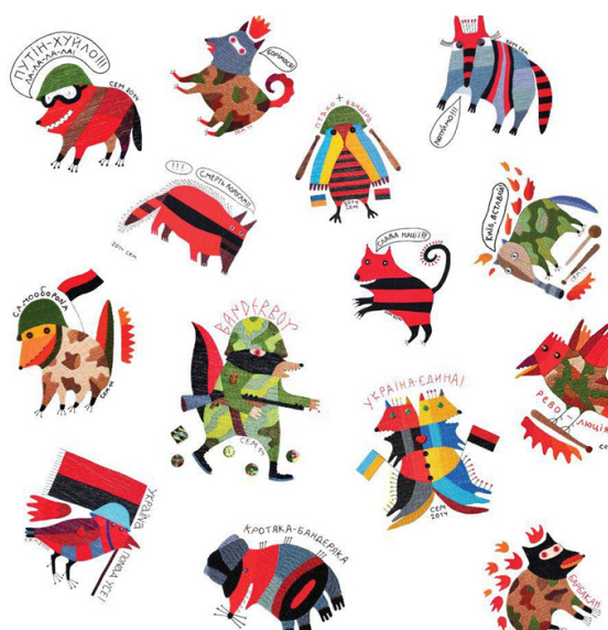
Іл. 4. І. Семесюк. Приклади зображень з «бандериками». [7]