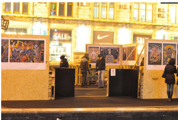
Іл. 1. «Мистецький Барбакан». У центрі – репродукції робіт «Горрор імені Верьовки» та «Батько Махно», авторства І. Семесюка. [4]