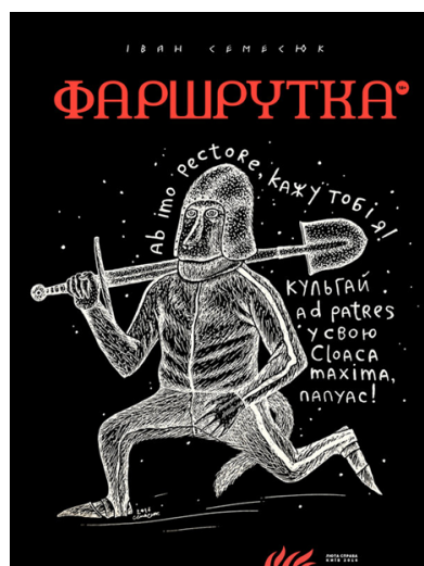
Лл. 9. Обкладинка книжки «Фаршрутка». [13]