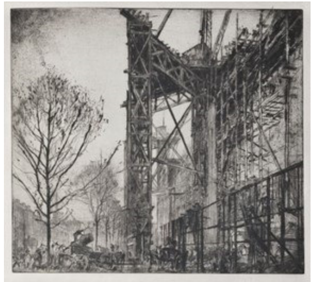
Іл. 2. Френк Бренгвін (Sir Frank Brangwyn). «Риштування № 1» («Scaffolding, No. 1 (L'Échafaudage)»). Офорт. Суха голка, чорнило. 62×74 см. 1919. [4]

Костантен Мен'є (Constantin Émile Meunier), провідний французький представник цього типу реалізму, був членом нового товариства художників і скульпторів і, своєю чергою, сильно вплинув на Френка Бренгвіна (Sir Frank William Brangwyn) – англійського художника, який був одним із піонерів індустріального пейзажу. Гравер і монументаліст Ф. Бренгвін вловив особливу ритмічну і монументальну красу виробничих об'єктів, естетику ажурних конструкцій, і вплинув на майстрів промислового пейзажу багатьох країн. У техніці офорту, сухої голки, акварелі створені твори, які стали класикою індустріального пейзажу. Фігури у його композиціях – це робітники, люди, які беруть участь у мрії прогресу, які керують машинами, будують великими руками та гордо напружують м'язи. Їхня зовнішність така ж героїчна, як і їхні завдання [3], [4] (іл. 2).