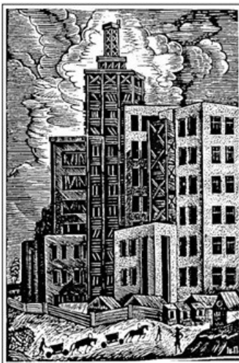
Іл. 4. І. Падалка. Будинок промисловості. Колекція NAMU. Папір, дереворит. 1927. [6]

Більшість митців звертали увагу на індустріальні краєвиди лише час від часу, проте були й ті, хто зробив цей жанр справою усього свого життя.