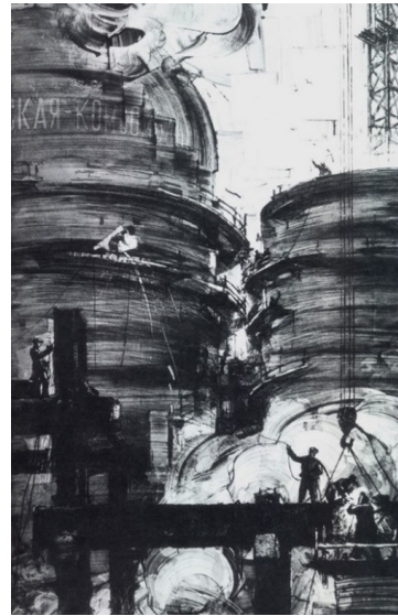
Іл. 5. М. Родзін. Ударна будова. Із серії «Комсомольські будови Дніпропетровщини». Офорт. 1958. [7]

конструктивізм і представники усіх цих напрямів, так чи інакше, віддали данину захопленню технікою [7] (іл. 5).