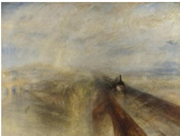
Іл. 1. Дж. М. В. Тернер (J. M. W. Turner). Дощ, пара та швидкість. Велика західна залізниця («Rain, Steam, and Speed – The Great Western Railway»). Полотно, олія. 91×121,8 см. 1844. [2]

Батьківщиною індустріального пейзажу вважають Англію, оскільки саме вона стала першою країною з розвиненим промисловим виробництвом. Наближення духу технічної ери, у новаторській для середини ХІХ ст. художній формі, відображене в картині Вільяма Тернера (William Turner) «Дощ, пара і швидкість» (1844), де перед нами потяг, що мчить [2] (іл. 1).