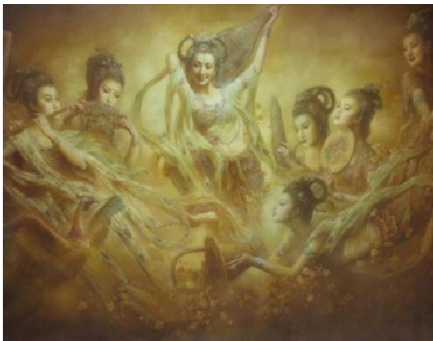
Лл. 6. Цзен Хао. «Фейтянь» («Апсари, що летять»). Олійний живопис. [10]