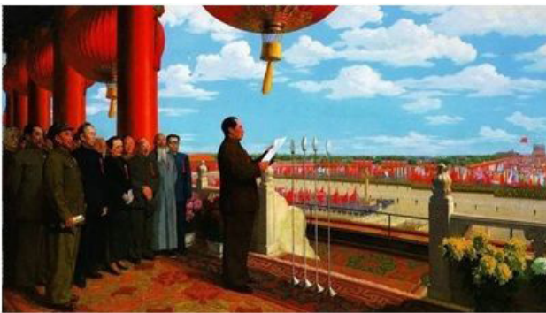
Іл. 4. Дун Сівень. «Церемонія проголошення створення КНР». Олійний живопис. [10]

Подібні тенденції демонструє ще одна робота Дун Сівень – «Кайго-дадянь» («Церемонія проголошення створення КНР») (іл. 4).