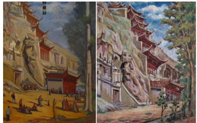
Іл. 5. Чан Шухун. «Дев'ять поверхів». Олійний живопис. [10]

В олійному живописі Чан Шухуна «Цзю-Цен-Лоу» («Дев'ять поверхів») (1952) автор чітко дотримується традиції поєднання ліній та колірних характеристик, які ми бачимо на фресках. У роботі гармонійно поєднуються прозоре блакитне небо і яскраво-червоні кольори дев'яти поверхів, водночас готи на стінах скель відтіняються теплим сірим тоном. Яскраве й динамічне моделювання персонажів на картині також запозичене з печерних розписів поблизу Дуньхуану (іл. 5).