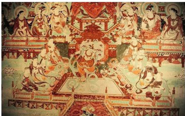
Іл. 1. Фреска. Дуньхуан. Грот № 25. [8]

Фрески Дуньхуану присвячені відтворенню гармонійного життя людини у таких аспектах, як музика і танець, вірування та світогляд, кольорові й композиційні рішення. Зазначимо, що танець і музика у фресках Дуньхуану демонструють синтез різних національних культур, який виник насамперед через унікальне географічне розташування місцевості (іл. 1).