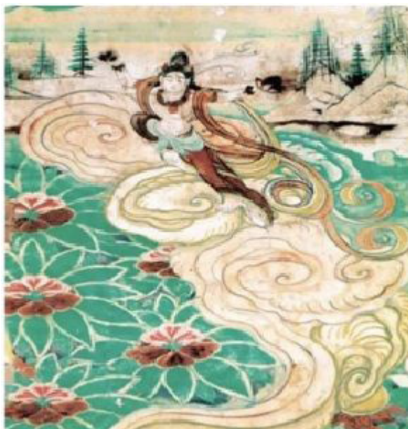
Лл. 7. Фреска. Фейтянь. Дуньхуан. Грот № 25. [8]

Безумовно, новаторство Цзен Хао полягає в тому, що він по-новому інтерпретував буддиські традиції Дуньхуану. Образ богині милосердя Гуань Іннь демонструє поєднання