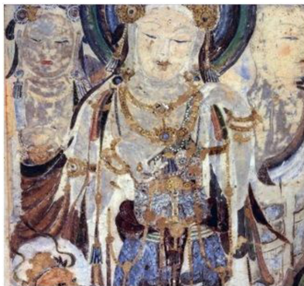
Іл. 2. Фреска. Гуаньшінь. Дуньхуан. Грот № 57. [8]

переважно презентують використання чорних чи темних тонів» [1, с. 39].