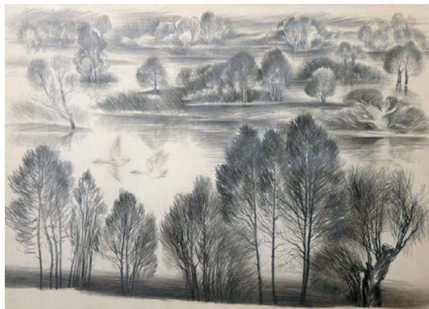
Іл. 6. В. Сергєєв. Седнівська весна. Олівець. 50×70 см. 1980. [З родинної колекції художника]

Практична значущість. Зафіксовані у дослідженні творчі принципи В. Сергєєва,