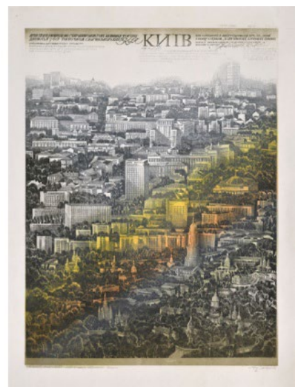
Іл. 5. Б. Тулін. «Київ» із триптиха «Печерськ». Кольоровий офорт. Розмір листа: 65×50 см. Розмір відбитка: 54×42 см. 1982. [20]