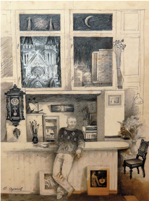
Іл. 3. В. Сергеев. У майстерні. Олівець. 30×20 см. 1995 (?). [З родинної колекції художника]

його 1987 року переселили з нежитлового фонду з вул. Трьохсвятительської. Отже, датування укладачів альбому для даного малюнка 1995 роком може бути піддане сумніву.