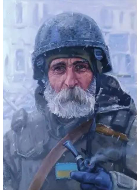
Іл. 3. С. Позняк. Дідусь – воїн тероборони Одеси. 2022. [1]

Загалом творчість митця воєнного періоду можна визначити як своєрідну візуальну хроніку. Його численні портрети військових і цивільних, а також композиції, що присвячені окремим подіям війни, формують образ сучасного українського воїна як носія відповідальності й моральної стійкості. Таким чином, у роботах С. Позняка портрет стає не лише жанровою формою, а й способом фіксації історичної пам'яті.