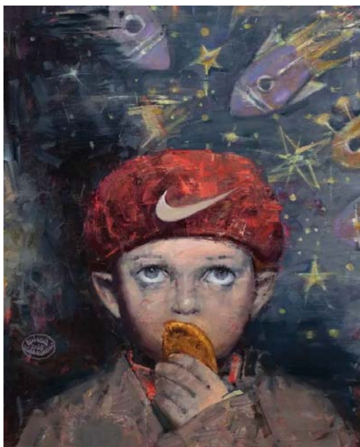
Іл. 5. В. Шерешевський. Київська перепічка. 2023. [2]

Важливою рисою творчості В. Шерешевського є поєднання драматизму та іронічної інтонації. Художник уникає прямого пафосу, замінюючи його метафорою, гротеском і культурною алюзією. Іронія в його роботах не заперечує серйозності теми, а стає способом дистанціювання та збереження внутрішньої рівноваги в умовах травматичної