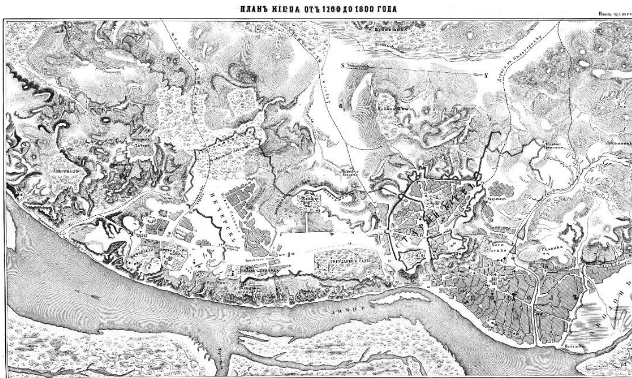
Іл. 2. План Києва, розроблений А. Меленським. 1803. [10]

характеризується досить високою якістю та прорисовкою окремих районів середмістя Києва, зокрема Старого Києва, Подолу, Царського саду, Печерська, Звіринця. Цифровими позначеннями нанесені окремі архітектурні пам'ятки, насамперед церкви і монастирі. Крім того, схематично викладені відомості про передмістя.