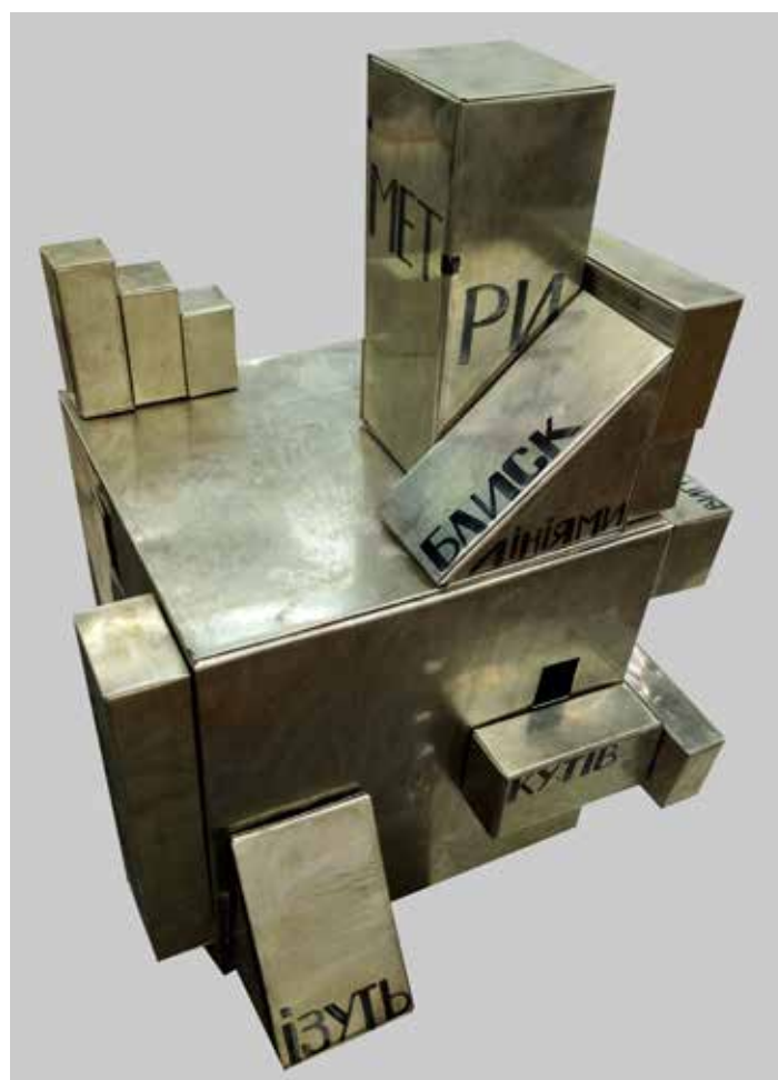
Іл. 4. К. Степась. «Конструктивізм». Метал, маркер. 2018.