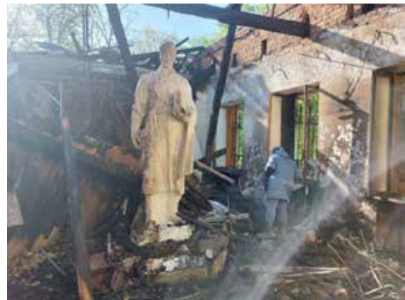
Іл. 1. Знищений ракетним ударом музей Сковороди зі збереженою скульптурою українського філософа. [13]

Виклад основного матеріалу. Бойові дії виявили нові аспекти, які були непередбачуваними та не включеними в загальні вимоги щодо забезпечення захисту й евакуації цінностей музейних закладів. Зокрема під удар потрапили музейні експозиції та фонди музеїв Херсона, Маріуполя, Харкова, Одеси й багатьох інших міст України. За даними Міністерства внутрішніх справ України, у період з 24 лютого 2022 року до 25 грудня 2023 року зруйновано або пошкоджено 872 об'єкти культурної спадщини України. З пам'яток національного значення – 120, місцевого значення – 682, шойно виявлених – 70 [12]. Кількість постраждалих або знищених матеріальних та історичних цінностей до цього часу невідома (іл. 1) [13].